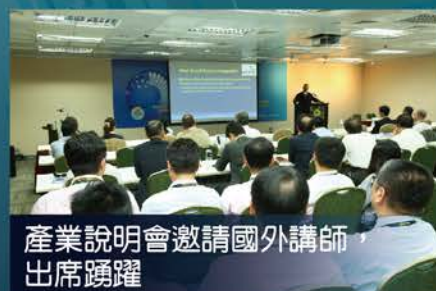
產業說明會邀請國外講師，出席踴躍