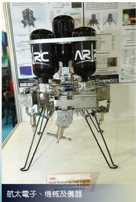
航太電子、機械及儀器