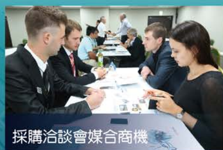
採購洽談會媒合商機