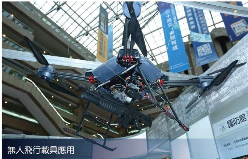
無人飛行載具應用